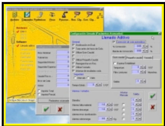
Utilidad para la configuración del indicador de peso desde cualquier ordenador.