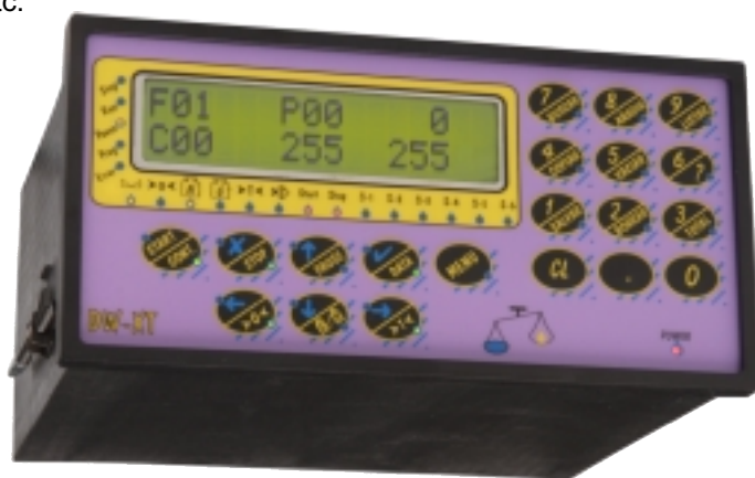
Indicador de Peso Multifunción DW-XT